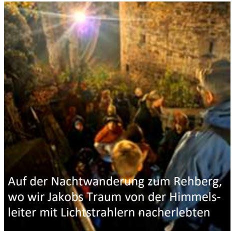
Auf der Nachtwanderung zum Rehberg, wo wir Jakobs Traum von der Himmelsleiter mit Lichtstrahlern nacherlebten

Ende September veranstaltete Time4Kids im Burggut eine Talentshow. Ausgehend von Jesu Gleichnis von den anvertrauten Talenten erkannten wir: Jeder hat Talente! Und sogleich zeigten die Kinder, was sie gut können. Im Oktober hatten wir zum zweiten Mal eine Kinderübernachtungsaktion im Burggut.